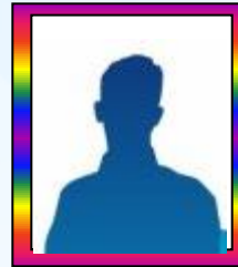
ปรัชญา หาญพล รองประธาน